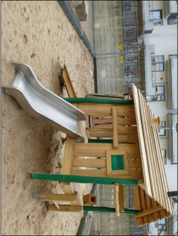
Spielhäuschen Hummel (Ausführung Holzpfosten)