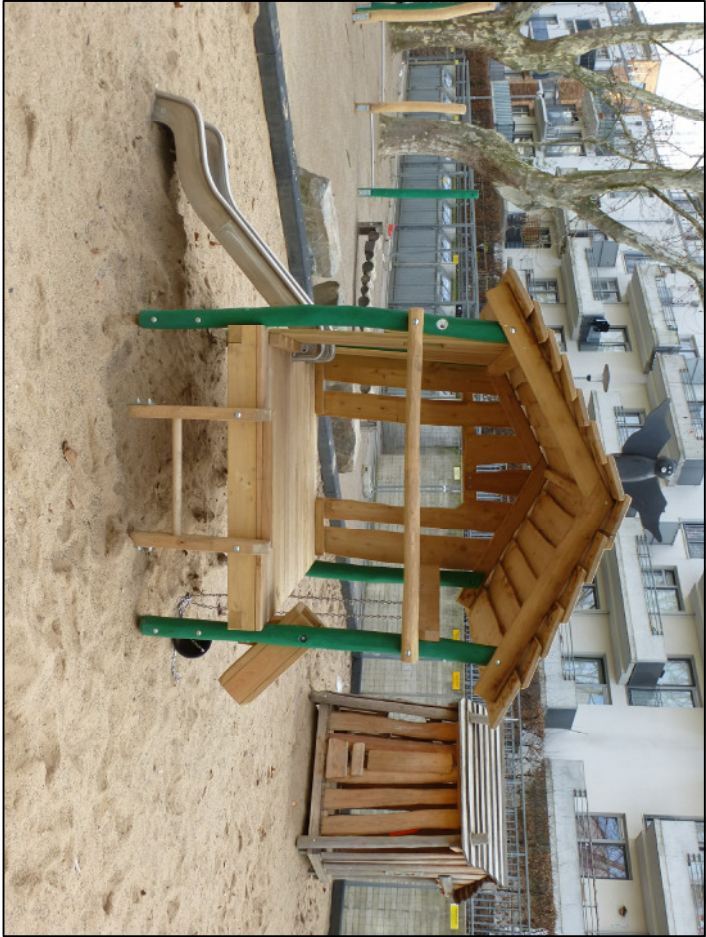
Spielhäuschen Hummel (Ausführung Holzpfosten)